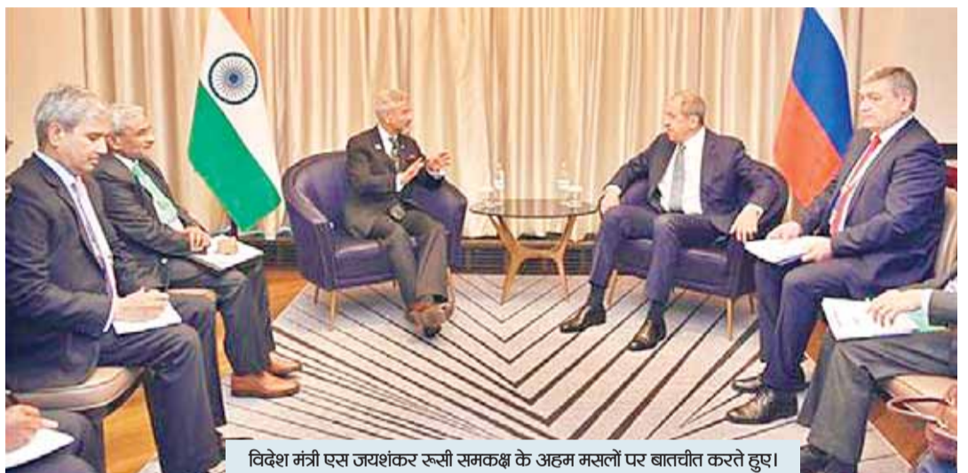
विदेश मंत्री एस जयशंकर रूसी समकक्ष के अहम मसलों पर बातचीत करते हुए।